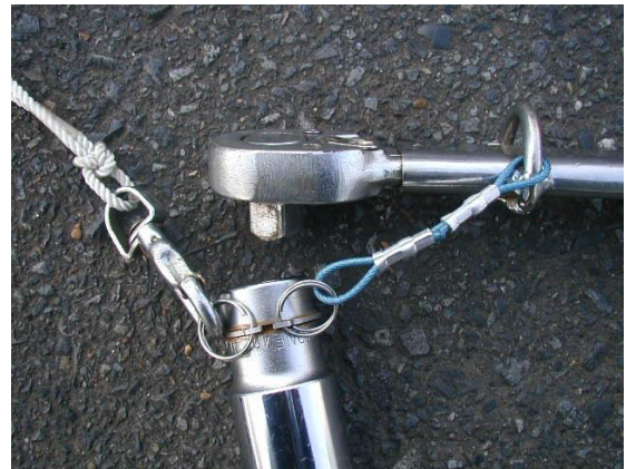
ソケット交換時・状態

2重リングをC型止め輪に取付けることで、交換時には片方の2重リングからステンレスワイヤーを外し、落下防止用ロープを付けて対応することでソケットがフリー状態にならず、落下阻止出来るようにした。